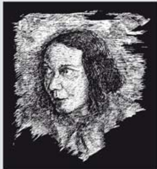
Lea Grundig: Im Tal des Todes

Zeichnungen zur Verfolgung, Vernichtung und zum Widerstand von Jüdinnen und Juden